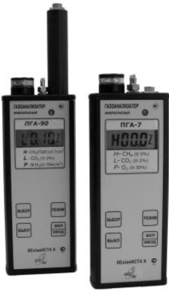
Рисунок 1 - Общий вид газоанализатора